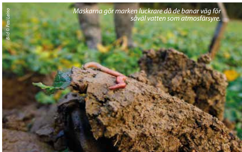
Maskarna gör marken luckrare då de banar väg för såväl vatten som atmosfärsyre.