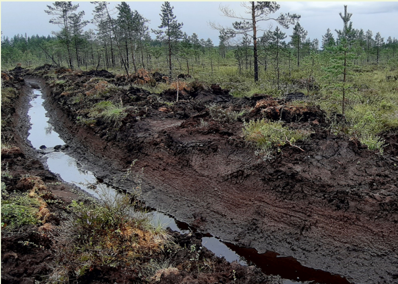
Jouto- ja kitumailla tehdään edelleen taloudellisesti kannattamattomia uudisojituksia, vaikka niitä on jo vuosia kehoitettu välttämään metsänhoidon suosituksissa.

Tarve päivittää Suomen vesilain metsäojituspykälää on kiistaton. 1960-luvun säädökset ovat ajastaan jäljessä. Ne aiheuttavat turhia yhteiskunnallisia kustannuksia ja ympäristöhaittoja. On aika tuoda vesilaki 2000-luvulle ja siirtyä kuivatuslaista metsien terveen vesitalouden ohjaukseen.